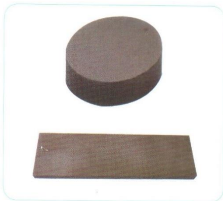
Prodotti con elevata resistenza alla corrosione